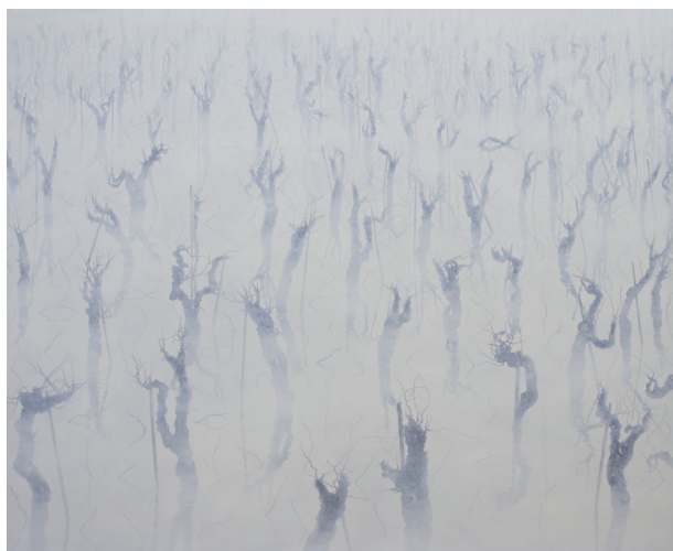
Lucio Fanti Brouillard dans les vignes , 2006 Huile sur toile 130 x 162cm Collection de l'artiste