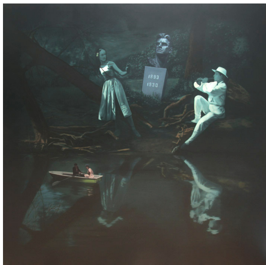
Lucio Fanti Poesia Ufficiale , 1976 Huile sur toile 200 x 200 cm Collection de l'artiste